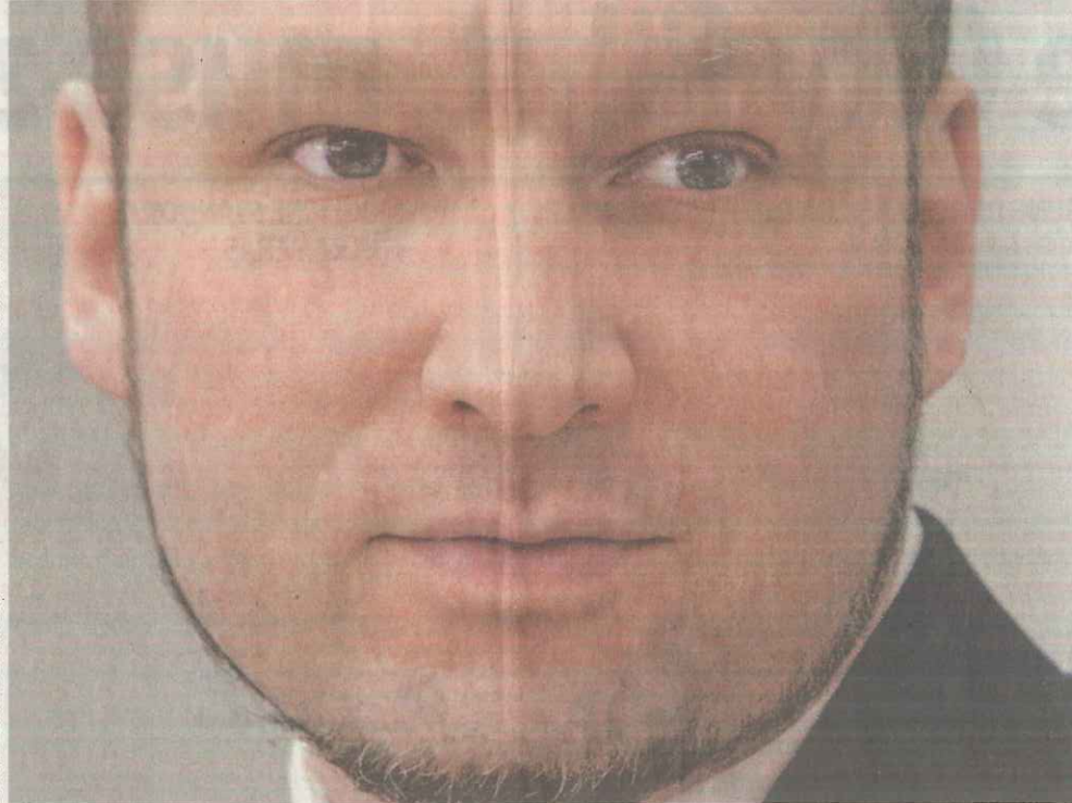
AP / SHAN LYSEBERG SOLIUM